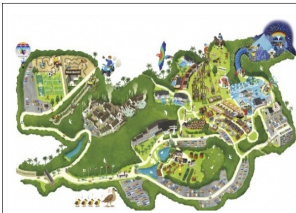
イメージ 「ネスタリゾート神戸」