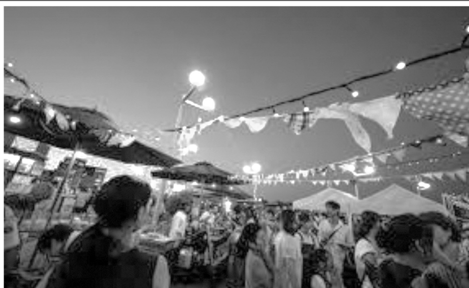
イメージ 「ズンチャッチャ 夜市 : 大東市」